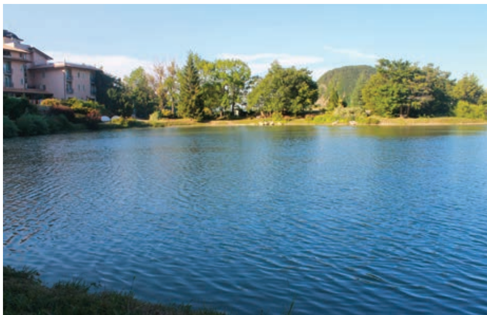
Fig. 2. Il lago di Montecopiolo.