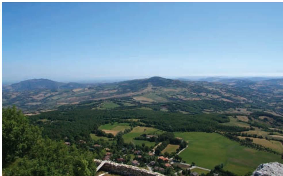
Fig. 4. L'area del "barco ducale" vista dalla cima del castello di Monte Copiolo. Il barco, in parte, corrispondeva al bosco visibile in fotografia. Sullo sfondo la Repubblica di San Marino ed il monte San Paolo.