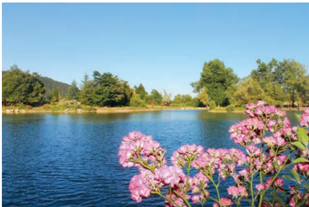
Fig. 3. Il lago di Montecopiolo.