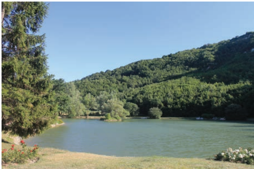
Fig. 1. Il lago di Montecopiolo.